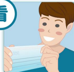
1 有顏色那一面朝外，鼻線要在口罩上方。