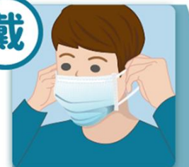
2 手拉兩側的耳帶，口罩中央對準自己後將兩側耳帶戴上耳朵。