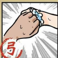
弓 搓揉指背與指節