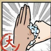
大 搓揉大拇指及虎口