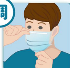
3 調整口罩，確實包覆口鼻與下巴。