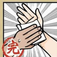
完 清洗手腕 清水沖淨 並擦乾雙手