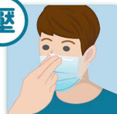
4 輕壓口罩上方的鼻線，讓鼻線與鼻樑貼合。